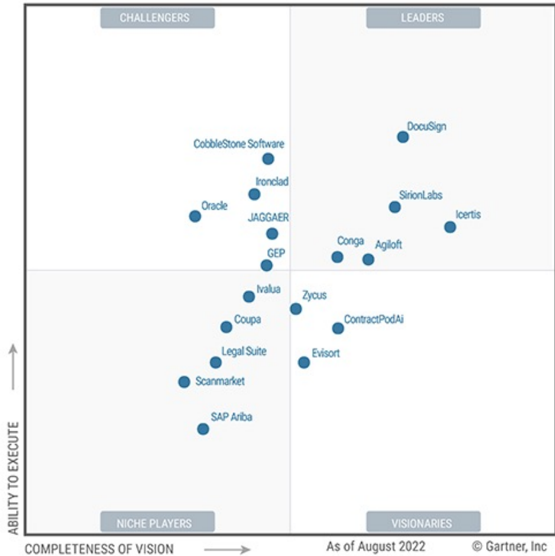
Figure 1: Magic Quadrant for Contract Life Cycle Management