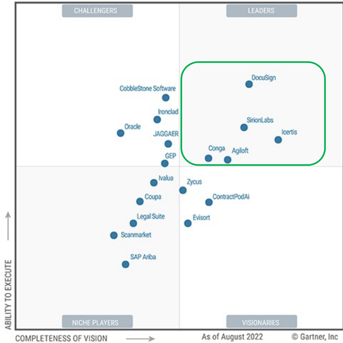
Figure 1: Magic Quadrant for Contract Life Cycle Management