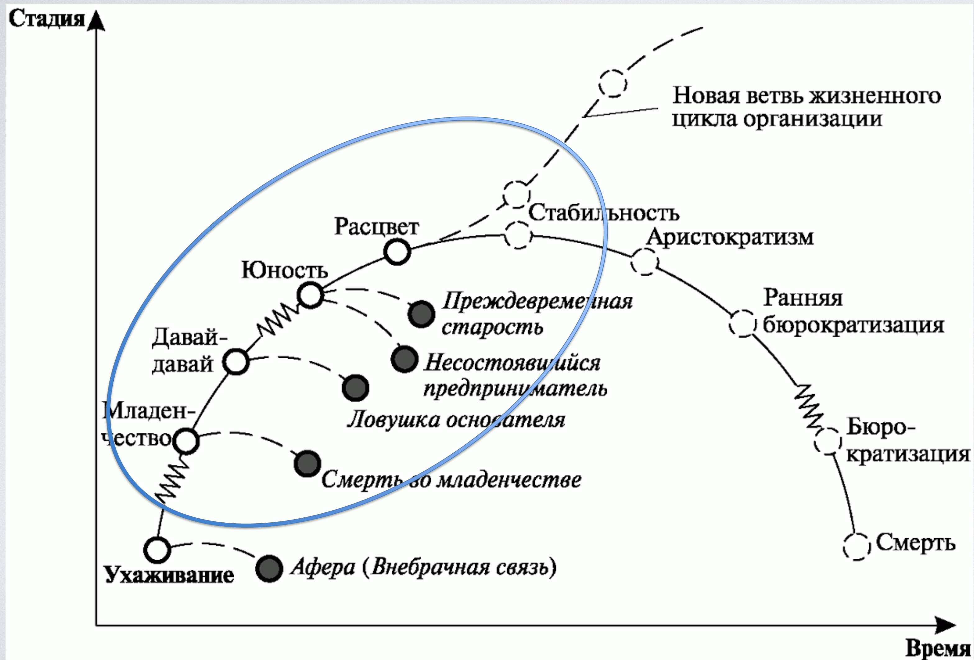
Жизненный цикл организации по Адизесу